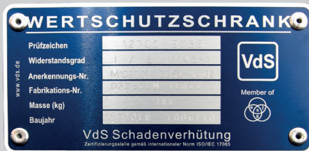
Marke der Zertifizierungsstelle VdS