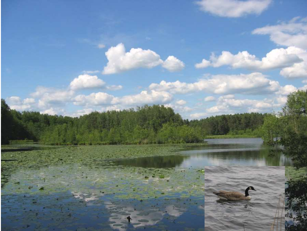
Im Naturschutzgebiet „Charlottenhofer Weihergebiet“

12.00 Uhr Mittagspause Gasthof „Holzwurm“ 92521 Hohenirlach www.landhotel-holzwurm.de